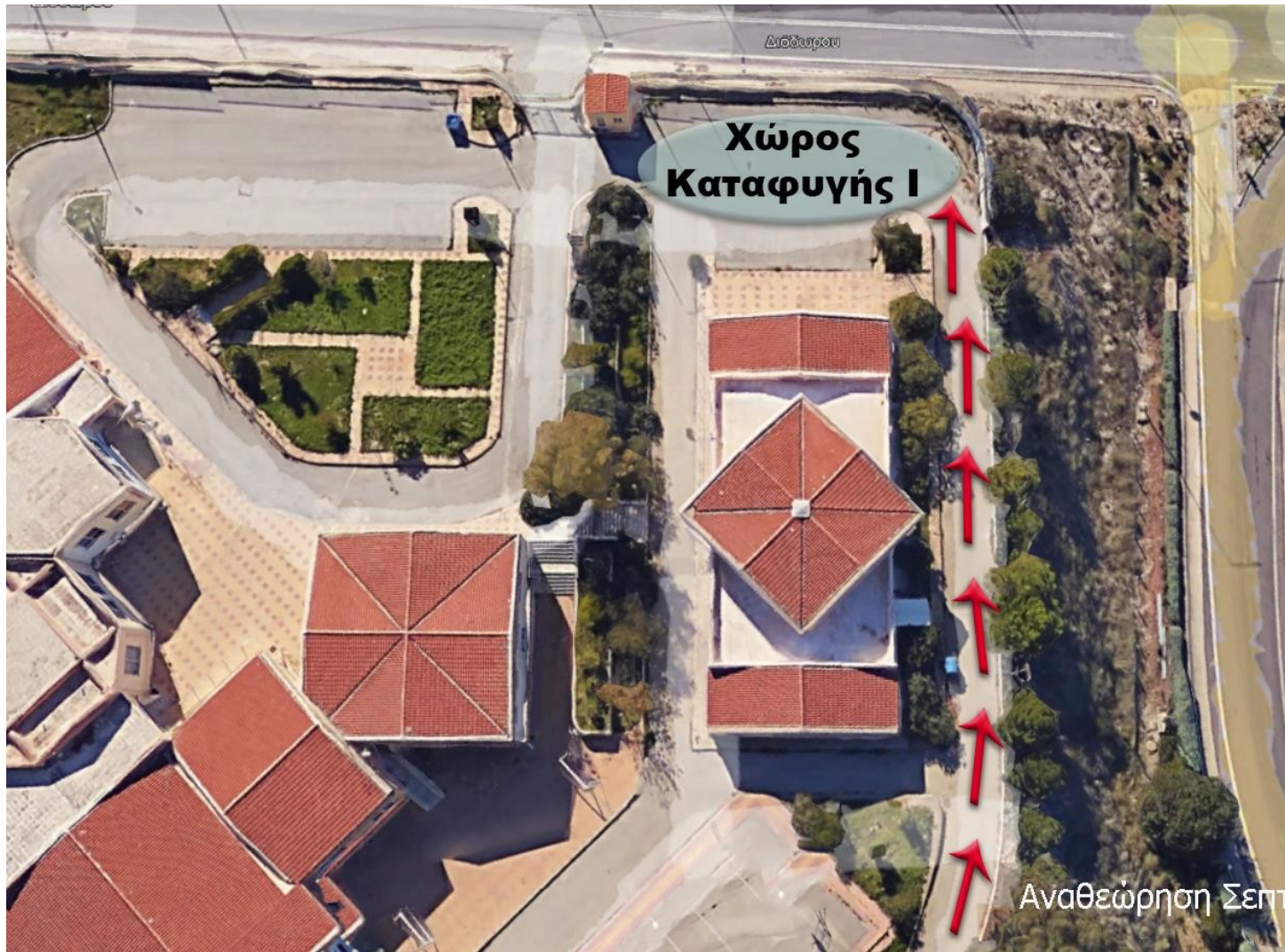
Χώρος Καταφυγής 1: Είσοδος-Εξοδος του συγκροτήματος