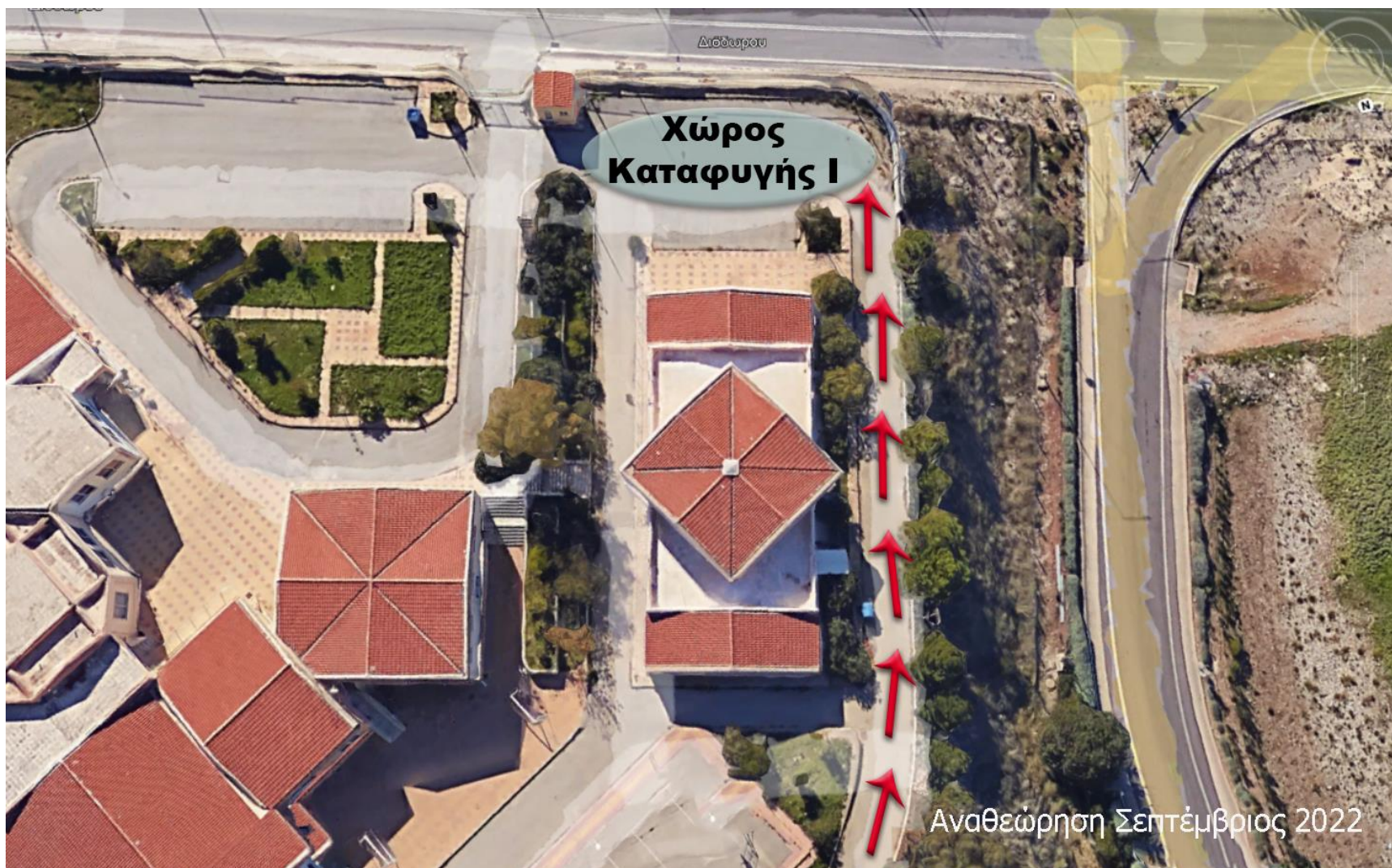
Χώρος Καταφυγής 1: Είσοδος-Εξοδος του συγκροτήματος